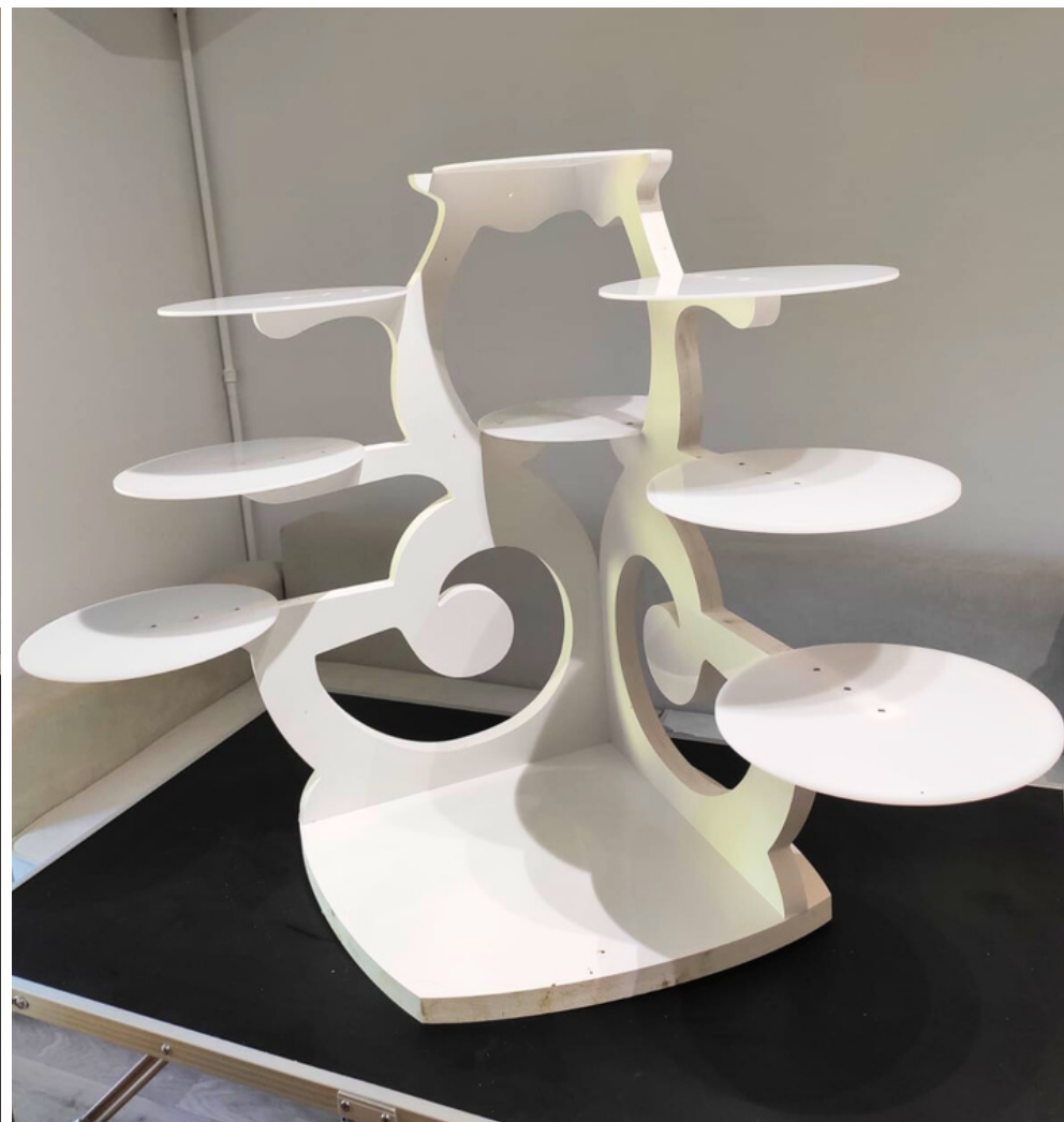
Présentoir "Cascade" 9 entremets