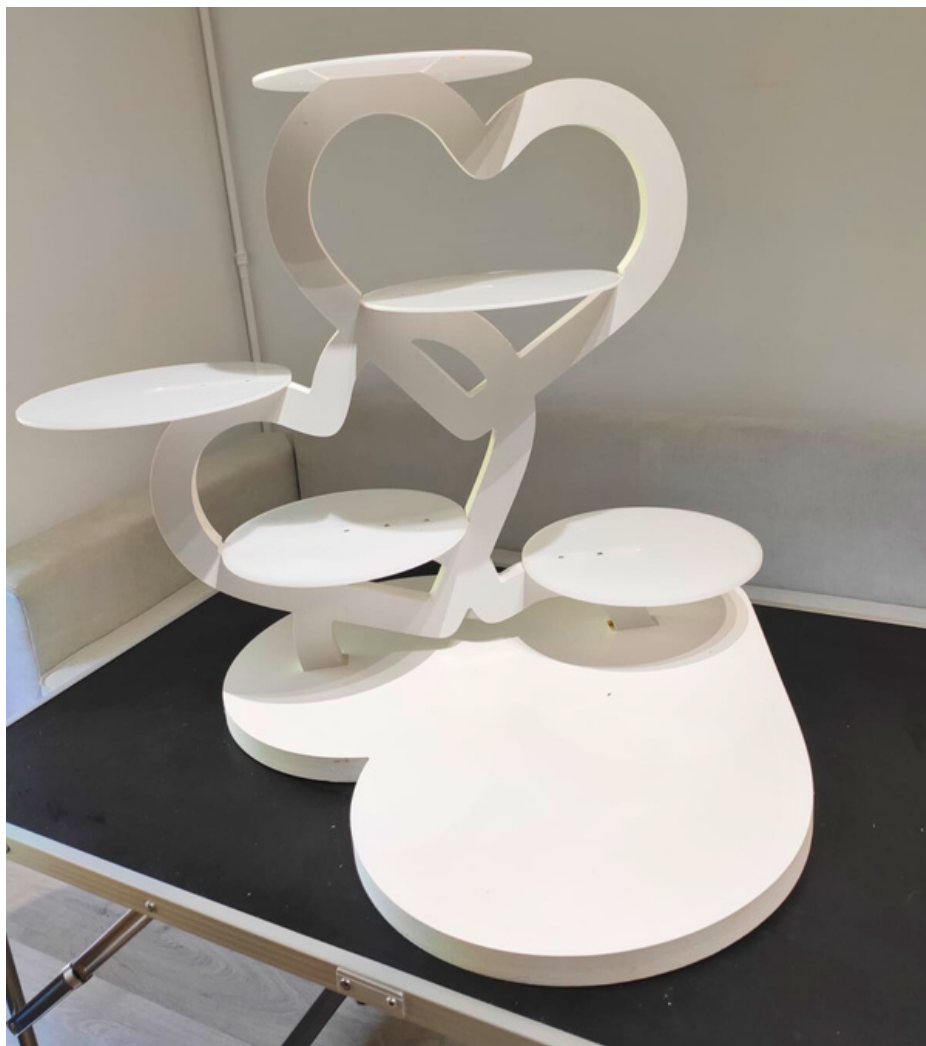
Présentoir "Coeur" 6 entremets